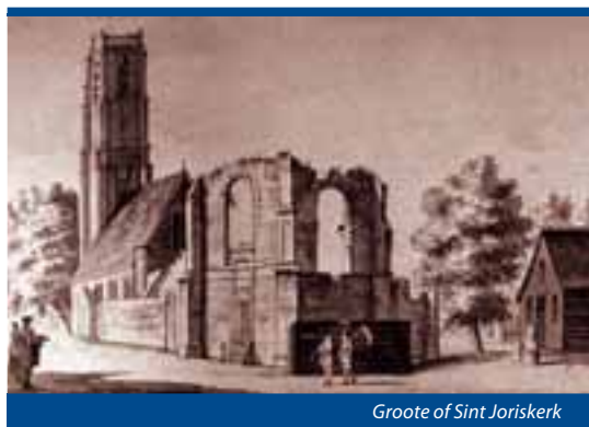
Groote of Sint Joriskerk

Al vroeg in de oorlog viel het nog maar kort geleden tot meer welvaart gekomen Westzaan als slachtoffer.