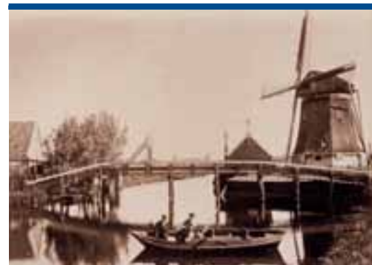
In 1890 was de molen Het Leven nog een onmisbare schakel in de waterhuishouding van de Polder Westzaan

De verdrijving van de Spanjaarden, de val van Antwerpen en de daarop volgende groei van Amsterdam zorgde echter voor een bijna onvoorstelbaar snel herstel. De Zaanse industrie met zijn wind-