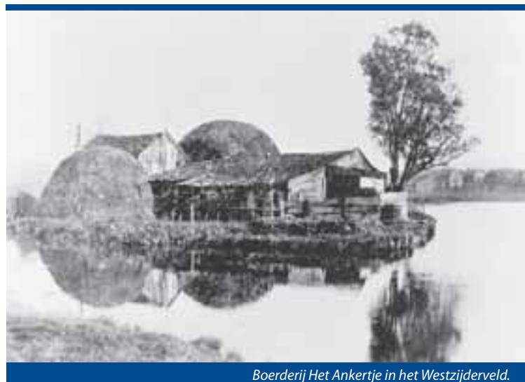
Boerderij Het Ankertje in het Westzijdeveld.

de eeuw zette men hier 's winters de sluisen open. Het slibrijke water uit het IJ kon zich zo vrij over de landerijen verspreiden. In Westzaan en Krommenie had men vanzelfsprekend met dat gebruik niet zoveel op. Daar had men wel last van het zoute water. Het vruchtbare slib was echter al in de Assendelver Zuiderpolder neergeslagen. De aanleg van de Nauernasche Vaart met dijken aan beide kanten in de vroege zeventiende eeuw maakte in elk geval voor Westzaan een eind aan die ergernis.