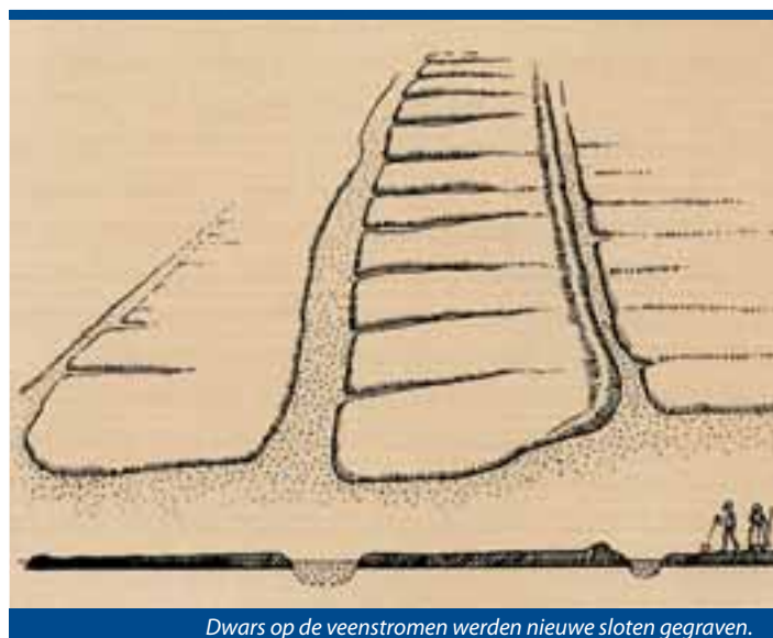
Dwars op de veenstromen werden nieuwe sloten gegraven.