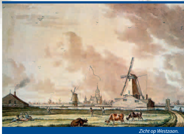
Zicht op Westzaan.

De meerderheid van de Westzaanse bevolking was en bleef intussen katholiek. Ze ging op zondag naar de mis, in elk geval op Eerste Paasdag. Men liet zoals het behoorde de kinderen dopen en brandde bij gelegenheid een kaarsje voor Sint Joris, de paro-