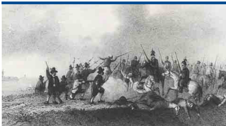
De Westzener 't Hoen verslaat in 1573 met 18 man 150 Spaanse Speerruiters op de dijk naar Haarlem.

In de waterrijke Zaanstreek was intussen van oudsher ruimte in overvloed. De wind werd er door niets gehinderd en woei er in alle jaargetijden. Voor het vervoer van de boomstammen hoefde men geen grachten of vaarten te graven. Beperkende bepalingen en beschermde gilden kende men niet. De vloten met Rijns eikenhout en de schepen met grenenhout uit het Oostzeegebied konden over het IJ ongehinderd doorvaren tot aan de Dam in Zaandam en tot aan de Overtoomsluis in Westzaan. Daar groeide vanaf de eeuwwisseling in korte tijd een nieuwe houtnijverheid die de Zaanstreek de komende eeuwen tot een ongekende bloei zou brengen. ■