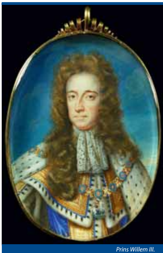
Prins Willem III.