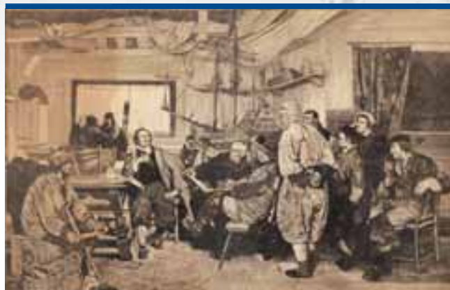
Tsaar Peter in Zaandam.

De Zaanse koopman en scheepsbouwer hadden weer vaste grond onder de voeten. De handel kon vooruit. Vol zelfvertrouwen ontving men in Zaan- dam rond de eeuwwisseling (1698) tsaar Peter, die hier en later ook in Engeland de scheepsbouw kwam bestuderen. De huizen van de Zaanse kooplieden en industriëlen werden groter, fraaier en lichter. De kleine ramen met kruiskozijnen, luiken en glas in lood maakten plaats voor grote 'Engelse' schuiframen. Het zwart geteerde buitenbeschoot met hooguit een witte daklijst erboven verdween. Het Zaanse landschap werd kleuriger en vrolijker. ■