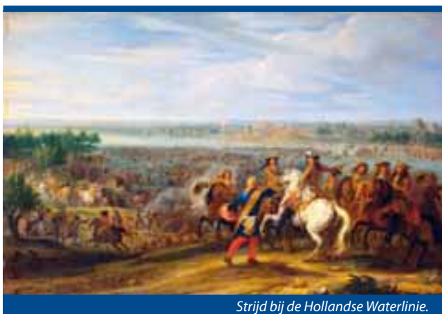
Strijd bij de Hollandse Waterlinie.