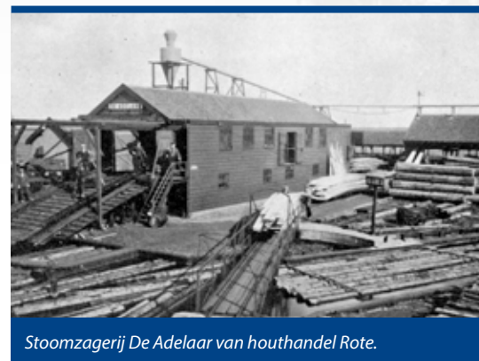
Stoomzagerij De Adelaar van houthandel Rote.

Niet alleen in het vooroorlogse Zaandam kreeg de houtbewerking vleugels. Ook in Westzaan-Zuid leefde de houtbewerking op. Houtzagerij Rote