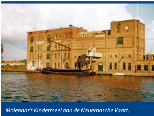
Molenaar's Kindermeel aan de Nauernasche Vaart.

het gras raakten, verdween uit het Zaanse landschap. Het eerst (1872) verbrandde de Westzaanse molen 't IJzeren Varken aan de Nauernasche Vaart. Die was gebouwd in 1653 en stond ter hoogte van de Middel. Over herstel werd niet meer gedacht. Zijn taak werd overgenomen door een stoomgemaal in Zaandam, de Soeteboom (1874). Vlak voor de eeuwwisseling (1899) sloeg de bliksem in bij watermolen De Guit, ook ooit gebouwd in 1653. De molen had haar naam sindsdien geleend aan het Westzaanse Watermolenpad. Aan het eind daarvan sloeg ze het polderwater uit op de Nauernasche Vaart. Na de brand volgde geen herbouw. De watermolen Het Leven in Zaandijk, gebouwd in 1632, werd tenslotte gesloopt in 1904. De as was gebroken. 'Eene watermachine met motor' nam het werk over. Vanaf dat moment zou De Woudaap (1651), gebouwd langs de Nauernasche Vaart bij Krommeniedijk, als enige Zaanse watermolen overblijven.