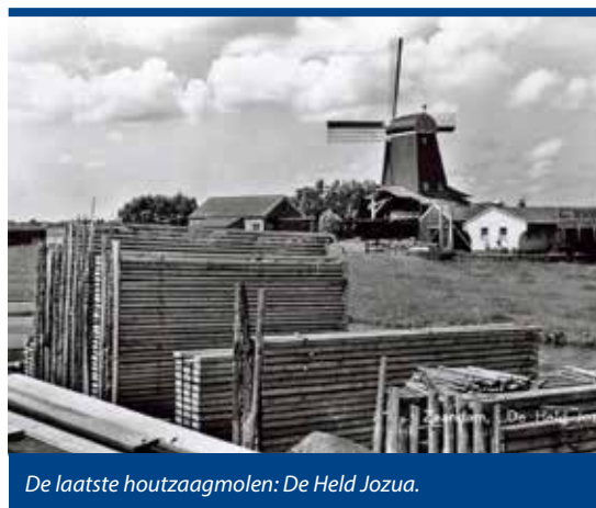
De laatste houtzaagmolen: De Held Jozua.

Intussen liep het getij voor de molens steeds sneller af. Van de in totaal 280 houtzaag-, pel-, olie- en verfmolens in 1851 was rond 1900 nog maar een derde over. Vooral in de houtzagerij ging de afbraak snel. Van de 114 houtzaagmolens in 1871 telde men er in 1900 nog maar 32. Ieder jaar waren er zo'n twee of drie verdwenen. Vierentwintig nieuwe stoomhoutzagerijen hadden het werk overgenomen. De oude Molenbuurt achter het station van Zaandam kreeg stilzwijgend een nieuwe naam: Houtveld. Deze naam zou tot in de 21ste eeuw standhouden. Welgeteld één houtzaagmolen zou hier overblijven, De Held Jozua uit 1719.