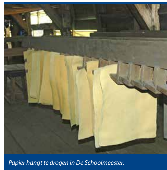
Papier hangt te drogen in De Schoolmeester.

Stoom en staal betekenden in het laatst van de negentiende eeuw het einde van de scheepvaart met zeilschepen. Dat bracht tegelijk een omwenteling mee voor de Assendelver en Krommenieër zeildoekweverij. De Assendelver weverij, slecht betaalde huisnijverheid, verdween. De Krommenieër weverij hield echter stand. Het zeildoek dat men maakte diende nu echter niet meer voor de scheepvaart, maar als onderlaag voor een nieuwe vaste vloerbedekking: linoleum. Niet voor niets spreekt men sindsdien nog steeds van 'vloerzeil'. De linoleumfabriek Krommenie begon zijn productie op industriële schaal in 1898. Sindsdien groeide het bedrijf gestaag. Tijdens de Eerste Wereldoorlog telde men al 125 personeelsleden. Nog steeds is de linoleumfabriek in Krommenie een belangrijke werkgever.