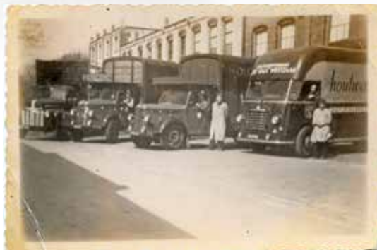
Het wagenpark van De Valk in 1949.

Stoom en staal zorgden in de laatste jaren van de negentiende eeuw ook voor een snelle ontwikkeling in de traditionele Zaanse verfmalerij. De verfmolens verdwenen. Van de drieëntwintig verfmolens halverwege de eeuw, waren er rond 1900 nog maar negen over. Vier moderne stoomverfmolens hadden intussen hun werk overgenomen. In Westzaan was de blauwselfabriek Avis al vroeg in de negentiende eeuw begonnen met stoomkracht (1833). Hout en wind waren echter betrouwbaarder gebleken. De blauwselfabriek De Blauwe Hengst, die de wisselvallige stoomkracht had afgelost, was de hele tweede helft van de eeuw in bedrijf gebleven. Toch moest ze uiteindelijk wijken. In 1907 begon ze een nieuw leven als korenmolen in Ouderkerk aan de Amstel.