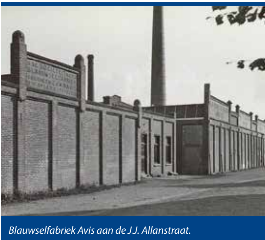
Blauwselfabriek Avis aan de J.J. Allanstraat.

In Westzaan startte Avis intussen de bouw van een enorm fabriekspand dat zich over tientallen meters uitstrekte langs de Krabbelbuurt. De voorgevel van het pand (gereed in 1916) toonde de ambitie van het bedrijf. In vier moderne talen was daar de naam aangebracht: Farbwerke Avis, Usines de Couleurs Avis, Avis Colour Works, Verffabrieken Avis. De hoge schoorsteen van de blauwselfabriek beheerste sindsdien het landschap rond Westzaan. Heel vriendelijk voor de omgeving was het bedrijf overigens niet. Bij de heersende wind waren de zwavelige dampen tot in de uithoeken van de Zaanstreek te ruiken. De omgeving kleurde blauw, de overalls van de werknemers ook. Heel winstgevend was het bedrijf evenmin. De moeilijke jaren tijdens en na de Eerste Wereldoorlog drukten verder de mogelijkheden. In 1919 keerde Avis voor het laatst dividend uit. Nieuwe producten, loodwit, schellak, schoensmeer en kunstharsperspoeder brachten nadien niet de gehoopte oplossing. Aan het eind van de wederopbouwjaren was sluiting niet meer te voorkomen (1966 - 1969). Nog lang zouden de massale en gestadig afbrokelende bedrijfspanden nog blijven leegstaan. Ze vormden bij tussenpozen een onderkomen voor de meest uiteenlopende gebruikers. Zelfs een theatervoorstelling werd er ooit georganiseerd. Pas