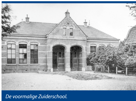
De voormalige Zuiderschool.

Voor de kinderen was er een kinderspaarbank. Daarop hadden de kinderen van de Noorderschool en de kinderen van de Zuiderschool tezamen bijna 1600 gulden ingelegd. De mijlpaal van het jaar 1900 werd gevierd met een gift aan de gemeente. Het raadhuis kreeg een luiddklok en een uurwerk. Sinds de torenval in 1843 had Westzaan immers geen openbaar uurwerk meer. Een klein klokje was er wel. Dat hing hoog in de raadhuisstoren en kon als dat nodig was met de hand geluid