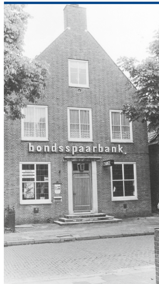
Kerkbuurt 24, de Nutsspaarbank, later Bondsspaarbank geheten.

worden. Ver droeg het geluid van dit klokje echter niet. Nu kreeg de toren voor het eerst een volwassen uurwerk en een luiddklok die ook op enige afstand te horen was. Het kleine klokje verhuisde naar 'eene ijzeren stelling' bovenop de voorgevel van de Zuiderschool. Ook deze school kreeg een bijbehorend uurwerk. De raadhuis-klok werd in de Tweede Wereldoorlog gevorderd en afgevoerd in de richting van Duitsland (1942). Na de oorlog kon de klok echter worden teruggevonden en werd ze in de raadhuisstoren teruggehangen. In de jaren vijftig verhuisden de Nutsspaarbank en de intussen opgerichte Nutsbibliotheek naar een nieuw fraai pand op Kerkbuurt 24, in de stijl van de Delftse School. Hier bleef het Nut, en nadien een professionele bankinstelling, nog een kleine halve eeuw werkzaam. Tegen de eeuwwisseling bleek er echter voor een bankvestiging toch te weinig werk. Het karakteristieke pand zou sindsdien dienst doen als woning.