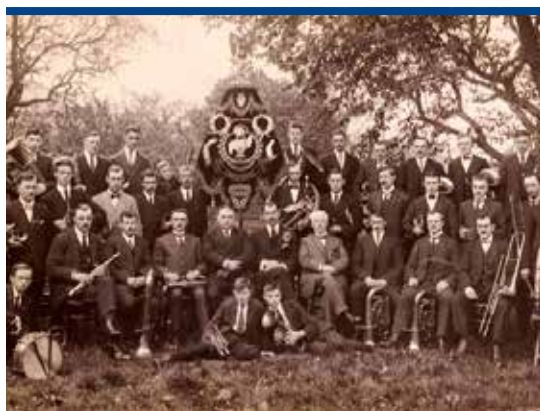
Crescendo bij de viering van het 20-jarig bestaan in 1920.

Reciteergezelschappen waren er in het dorp al sinds het midden van de negentiende eeuw. In deze gezelschappen las men gezamenlijk gedichten, verzen en andere schone letteren. Enkele illustere namen: het Kunstminnend Gezelschap (1850), de Rederijkerskamer Feith (1856), Onder Ons (1876), Excelsior (1876), Onderling Genoegen (1877), Ons Nuttig Streven (1877) en Ontwikkeling Zij Ons Streven (1894). In de nieuwe eeuw kwam het toneel meer in de belangstelling. De toneelvereniging Eensgezindheid (1902) zag het licht, evenals de vereniging De Jonge Westzener (1927) die zich behalve met sport, spel en huisvlijt ook met toneel bezighield, en nog altijd actieve toneelvereniging Herleving (1945). Van protestantse komaf was de intussen weer opgeheven toneelvereniging Guido Gezelle (1959).