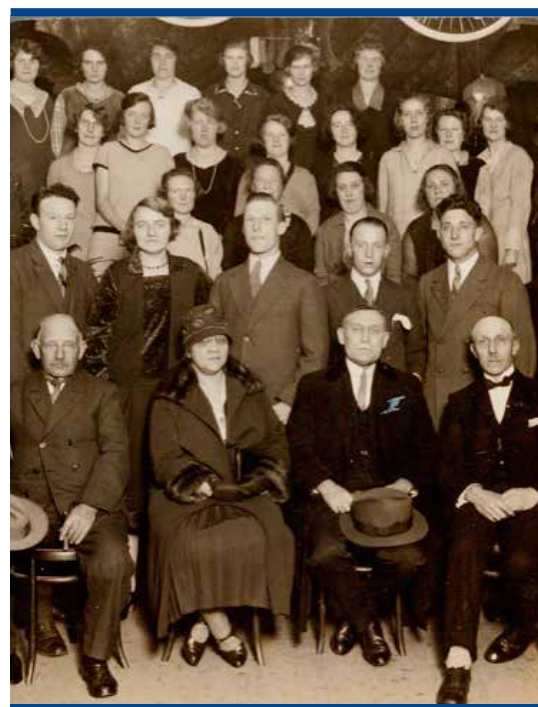
Zangkoor Concordia in 1951.

De Westzaanse Gemeenschap, een samenwerkingsverband voor de intussen vele Westzaanse verenigingen en stichtingen, zou worden opgericht direct na de Tweede Wereldoorlog (1945). Een veertigtal organisaties zou in de nieuwe eeuw elkaar binnen deze koepel vinden. Het breed verschijnende huis-aan-huisblad De Wessaner zou daarbij vanaf 1984 aan het Westzaanse verenigingsnieuws een vast podium bieden.