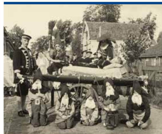
Openluchtvoorstelling van Sneeuwwitje en de zeven dwergen.