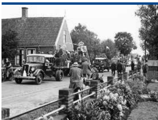
Optocht door het dorp tijdens bevrijdingsfeest op 6 juli 1945.

De Europese visie bleek houdbaar. De samenwerking op allerlei gebied zorgde ervoor dat ook na de wederopbouwtijd, zelfs tot ver in de nieuwe eeuw, de onderlinge tegenstellingen beheersbaar bleven.