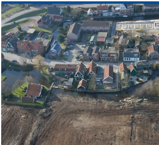
Boven Klein Engeland en onder het PontMeyerterrein.

Na 1972 zou de Westzaanse nieuwbouw beperkt blijven tot een invulling van het nog niet uitgegeven deel van het industrieterrein langs de Nauernasche Vaart (1993) en de verlaten fabrieksterreinen van Molenaar's Kindermeel (1983), Grootes (1987), Avis (tot 2018) en De Valk. Ook ten westen van het Zuideinde werd vanaf het laatste kwart van de 20ste eeuw geregeld gebouwd. In 1985 werd de eerste paal geslagen voor 'Klein Engeland', tegelijk het laatste project van de woningbouwvereniging Westzaans Belang als zelfstandige organisatie. Het grote verlaten bedrijfsterrein van Rote-Pont Meijer, ten oosten van het Zuideinde, zou echter nog lang moeten wachten op het slaan van de eerste paal. De nabijheid van het Amsterdamse Westelijke Havengebied en de aanwezigheid van diverse bedrijven maakten woningbouw daar niet eenvoudig (Westzaans Belang, 2005, p 29-39, 41-60).