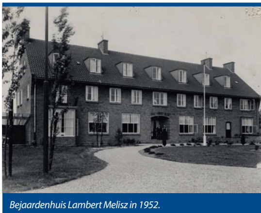
Bejaardenhuis Lambert Melisz in 1952.

Westzaan beschikte na de Tweede Wereldoorlog niet over een echt bejaardenhuis. Het dorpswees- en armenhuis achter de kerk bestond al sinds 1717 maar voldeed niet meer aan de eisen. Nieuwbouw was onvermijdelijk. Het oude weeshuis werd na bijna twee en een halve eeuw dienst afgebroken (1953). De meest waardevolle delen sloeg men op. Ze werden een tiental jaren later hergebruikt bij de bouw van restaurant 'De hoop op de zwarte walvis' aan de Zaanse Schans (Ankum e.a. 1991, p 336). Op de historische grond verrees een nieuw pand. Het werd een centraal gebouw in de historiserende stijl van de Delftse School met aan weerszijden vleugels. Daarin bevonden zich kleine woningen voor bejaarde echtparen.