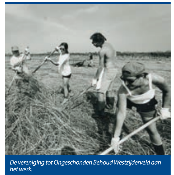
De vereniging tot Ongeschonden Behoud Westzijderveld aan het werk.

Ook na het terugwijzen van Progil stond echter het milieu nog niet voor iedereen vooraan. In 1976 voltooide de gemeente Zaanstad in de Zaanse Schans een forse vuilverbrandingsinstallatie. Vuil uit de hele regio, tot aan IJmond zou er kunnen worden verwerkt. De bouwplaats was bewust gekozen, aan een zijkanaal dat van het Noordzeekanaal leidde naar de Westzaner sluis. Aanvoer per schip zou daardoor ook mogelijk moeten zijn. Volgens de ontwerpers was de installatie volstrekt veilig. Ze veroorzaakte geen hinder en geen luchtverontreiniging.